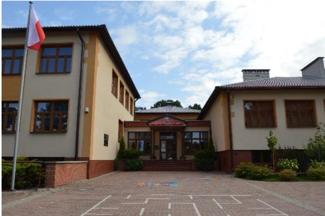
Budynek szkoły - widok od ul. Wczasowej

Zespół Szkół nr 2 im. Prymasa Tysiąclecia znajduje się przy ul. Wczasowej 5 w Markach