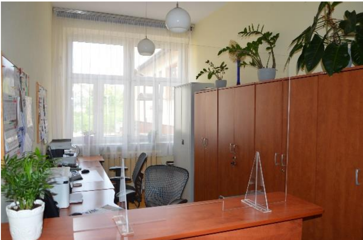
Administracja w środku