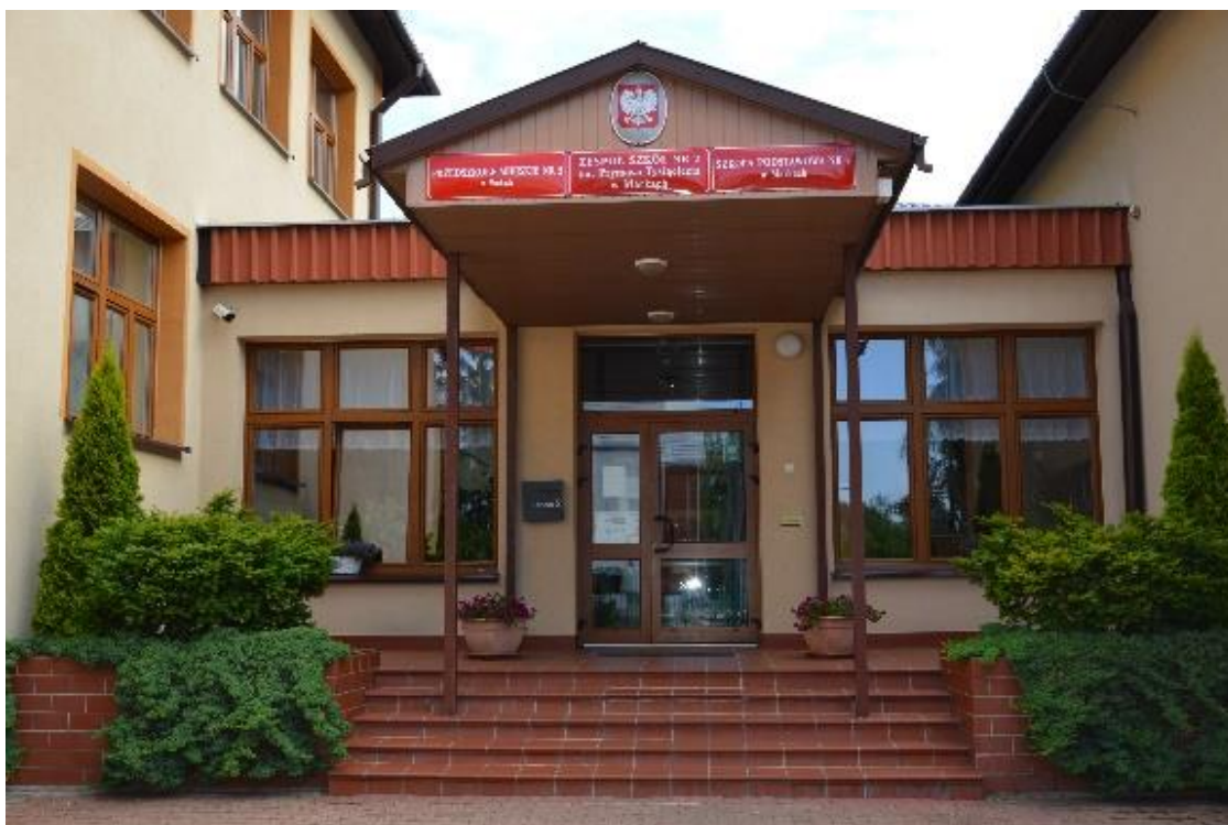
Wejście do szkoły – widok od strony ul. Wczasowej

Wchodzisz wejściem głównym od strony ulicy Wczasowej.