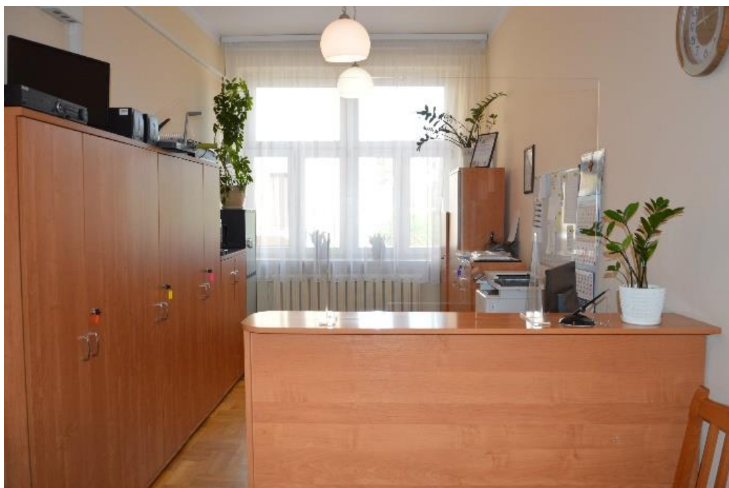
Sekretariat w środku