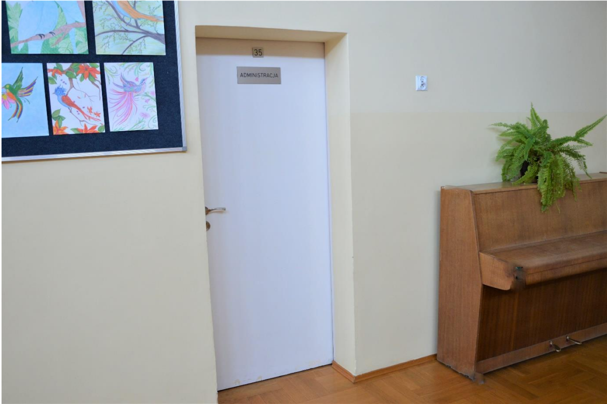
Wejście do administracji

Po wejściu na hol po lewej stronie zobaczysz kolejne wejście za sekretariatem i jest to wejście do administracji.