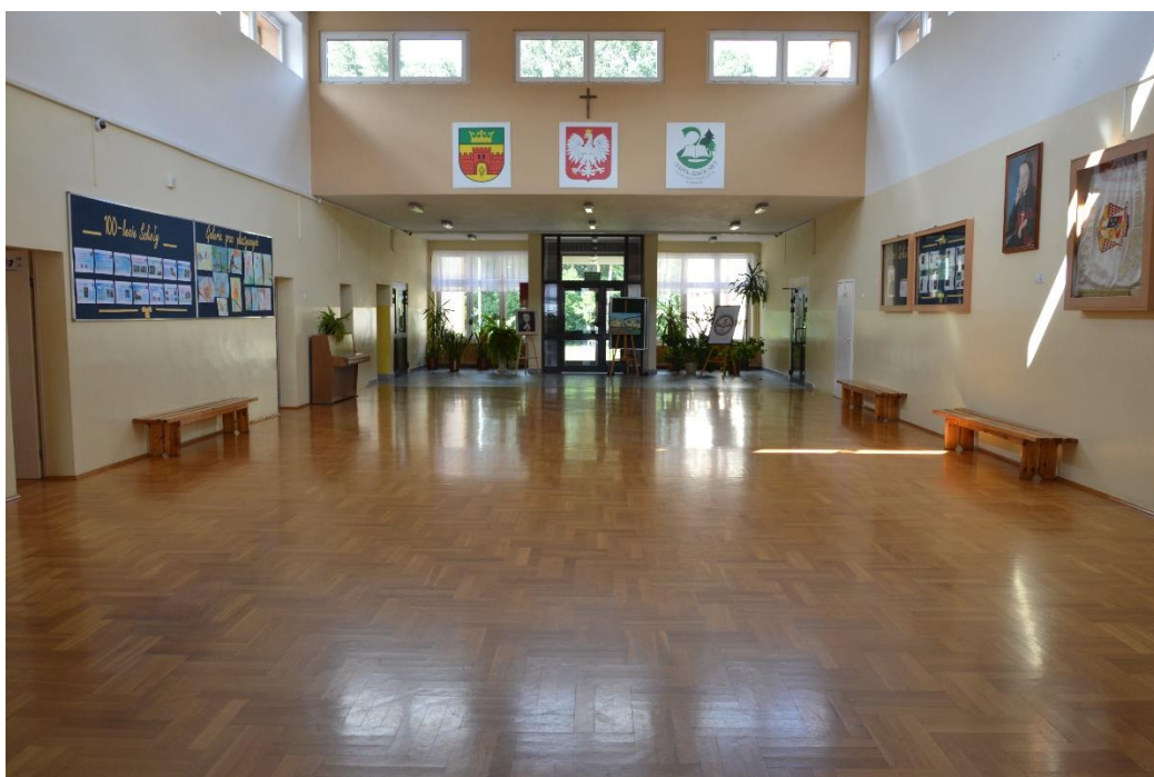
Widok po wejściu do szkoły

Gdy wejdiesz do budynku zobaczysz hol oraz po prawej stronie punkt informacyjny, którego pracownik służąc pomocą, pokieruje Ciebie do odpowiedniego pomieszczenia.